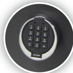
Fechadura electrónica de segurança com abertura retardada (opcionais)