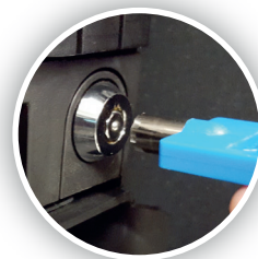
Fechaduras internas de acesso ao dinheiro (opcionais)